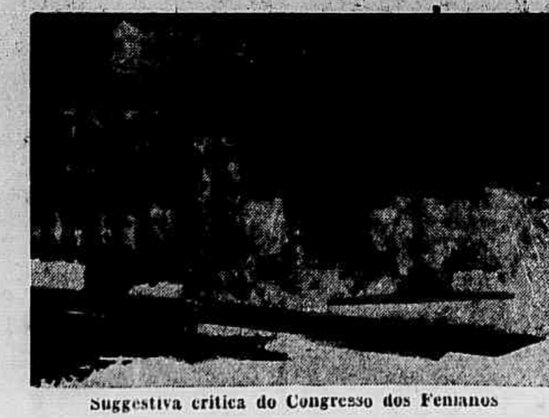
Suggestiva critica do Congresso dos Femininos